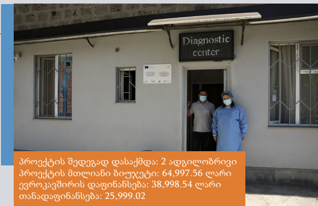
პროექტის შედეგად დასაქმდა: 2 ადგილობრივი პროექტის მთლიანი ბიუჯეტი: 64,997.56 ლარი ევროკავშირის დაფინანსება: 38,998.54 ლარი თანადაფინანსება: 25,999.02